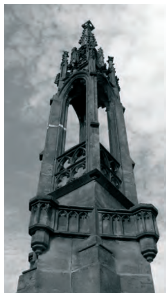
Fig. 7. Monumentul Fidelității din Cimitirul Eroilor, Timișoara: detaliu (2008).