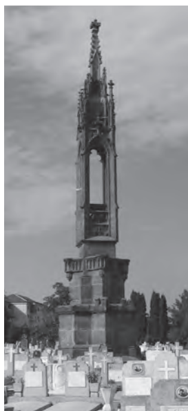
Fig. 6. Monumentul Fidelității în Cimitirul Eroilor, Timișoara, 2008.