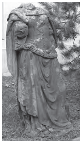
Fig. 5. Statuia Fidelității păstrată în curtea Muzeului Banatului, Timișoara.