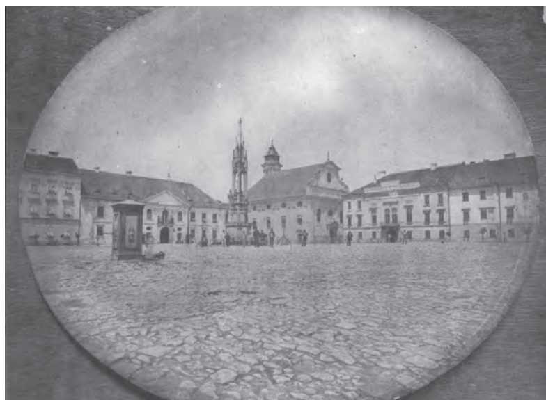
Fig. 3. Piața Libertății în 1869.