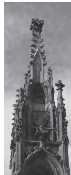
Fig. 8. Monumentul Fidelității din Cimitirul Eroilor, Timișoara: detaliu (2008).