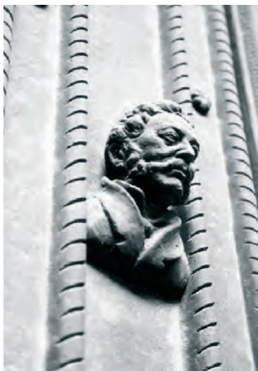
Fig. 1. Bustul arhitectului Jozef Kranner pe fațada Catedralei Sf.Vitus Praga (Foto Michal Patrný, 2001).

Fig. 1-5 – din bibliografie; Fig. 6-8 – imagini I. G. Panasiu.