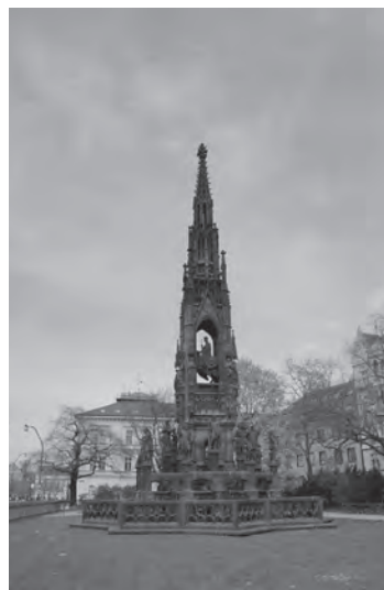
Fig. 2. Fântâna Krannerova Praga.