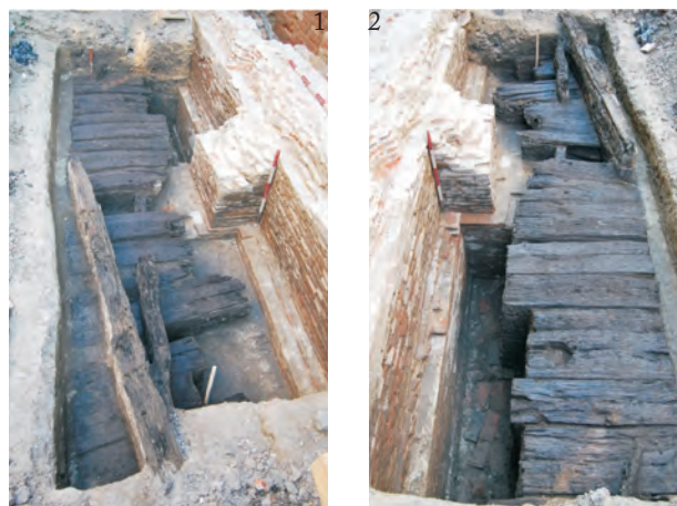
Fig. 7. Vederi asupra „podului de lemn” și a zidului Curții domnești (1 – vedere de la V la E; 2 – vedere de la E la V).

spre nord, în raport cu elevația, cu 30 cm, spre est cu 15 cm și aproape deloc (2 cm) spre vest, formând o treaptă la nivelul plintei zidului de incintă. Contrafortul este țesut la nivelul elevației și al fundației cu zidul de incintă al curții domnești. Zidul a suferit refaceri majore în timpul lui Constantin Brâncoveanu. La nord de zidul curții domnești, la o distanță de aproximativ 0,50 m și la o adâncime de 1,60 m față de nivelul actual, a fost surprinsă o porțiune importantă și bine conservată a străzii de lemn. Segmentele de podire cu lemn identificate în cursul săpăturilor indică faptul că strada actuală și-a păstrat traseul vechi, paralel cu zidul de incintă. Strada de lemn era realizată din scânduri cu următoarele dimensiuni: 30-40 cm lățime, 6 cm grosime și o lungime păstrată de cca 1,30-1,40 m. Scândurile erau fixate pe o bârnă, dispusă paralel cu axul lung al străzii, de cca. 10 cm lățime și 10 cm grosime. Fixarea lor era realizată prin cuie din lemn, cu diametrul de cca. 3 cm. Pe scândura nr. 3 (numerotarea începe din capătul estic) se observă un lăcaș (scobitură), de formă circulară cu diametrul de \pm 16 cm a cărei destinație este necunoscută, posibil de la un stâlp. Bârna pe care sunt fixate scândurile era la rândul ei așezată peste mai multe bârne mai scurte, dispuse și ele perpendicular pe axul străzii. E de remarcat că acestea din urmă erau nefinisate, multe dintre ele păstrând coaja pe ele.