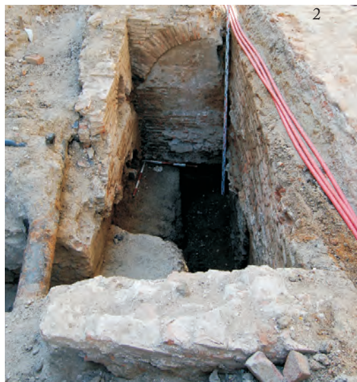
Fig. 4. Vederi generale asupra hanului și a casei de sec. XVII (1 – vedere de la SV la NV; 2 – vedere de la V la E).