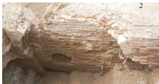
Fig. 5. Detalii ale casei din sec. XVII (1 – camera 1; 2 – camera 2).