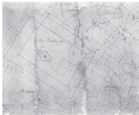
Fig. 9. Hanul Șerban Vodă pe planul maiorului Borroczyński (detaliu).