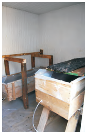
Fig. 8. Imagini din timpul procesului de demontare și conservare a componentelor „podului de lemn”.