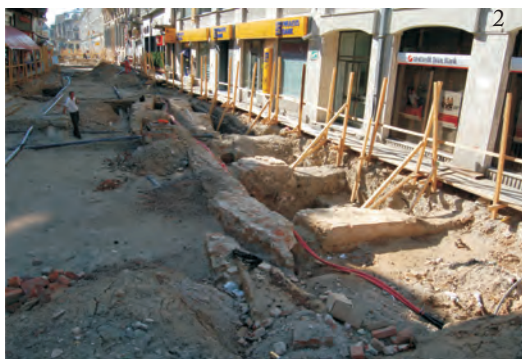
Fig. 3. Vederi generale (1 - vedere de la E la V; 2 - vedere de la NV la SE).