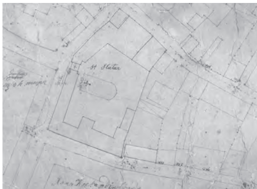
Fig. 2. Hanul Zlătari pe planul maiorului Borroczyn (detaliu).