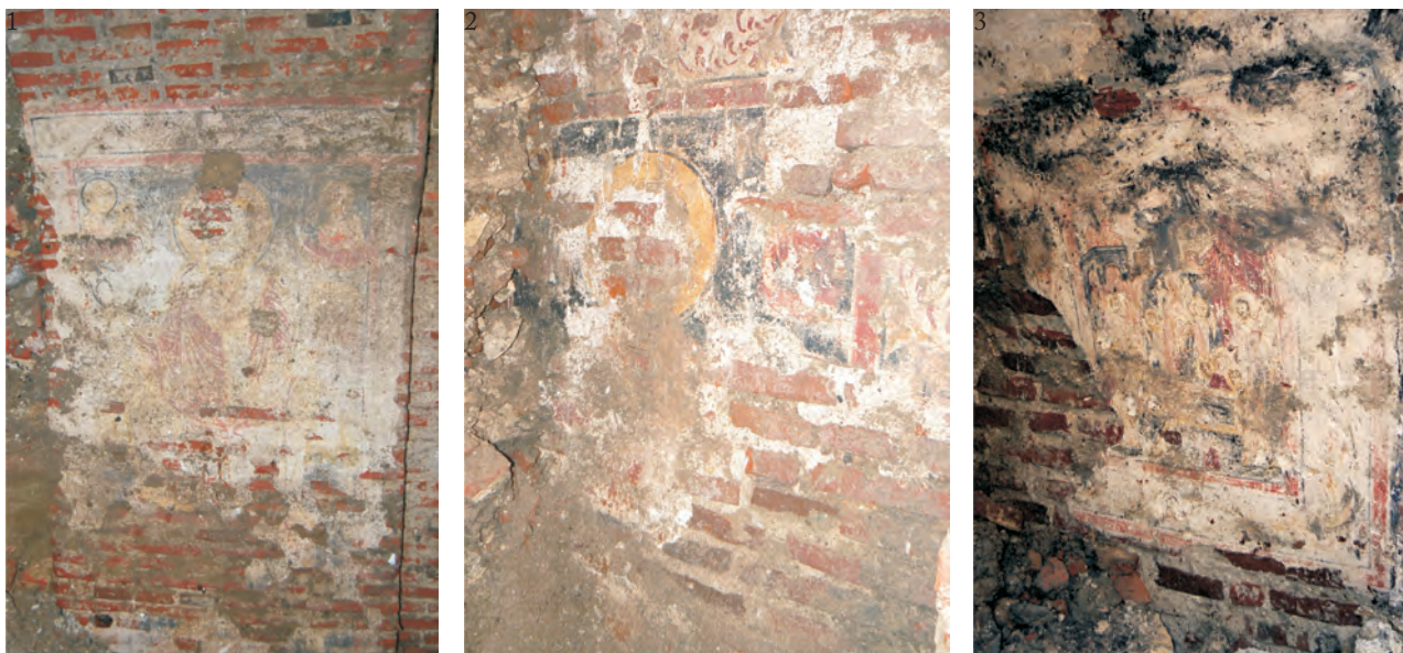
Fig. 11. Detalii de frescă: 1-2 reprezentarea Sf. Nicolae; 3 reprezentarea Adormirii Maicii Domnului.

o serie de pivnițe, ca și accesul dinspre stradă spre han. O ultimă intervenție a fost efectuată în vara anului 2009, când a fost finalizată cercetarea a trei dintre pivnițele hanului, dintr-un complex de șase (Fig. 10/1).