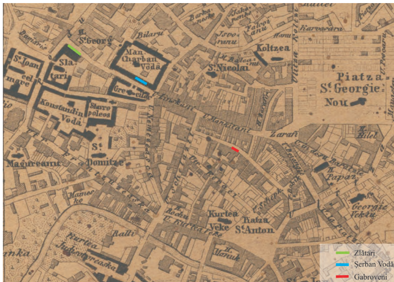
Fig. 1. Planul maiorului Borroczyn de la 1852 (detaliu) cu marcarea zonelor propuse pentru protejare.

suprafața care a putut fi cercetată, scade de la camera 1 (prima dinspre Calea Victoriei) spre camera 9, ultima fiind distrusă aproape integral de fundația clădirii actuale. Nici una dintre camere nu a putut fi cercetată integral din cauza intervențiilor moderne din zonă (cabluri, betoane etc.) și a traseelor de conducte de apă, gaz sau curent electric, care perforază și traversează toate zidurile identificate. Camerele 3-9 au fost distruse în proporții variabile de groapa fundației clădirii actuale. O singură cameră, a doua identificată dinspre trotuarul actual al Căii Victoriei, a putut fi surprinsă în întregime, având dimensiunile de 4,50 x 3,70 m.