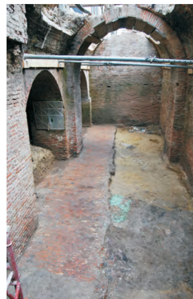
Fig. 10. 1-Vedere generală de la est la vest; 2-3 Zona propusă pentru conservare-restaurare: 2. vedere generală de la vest la est; 3. vedere generală de la est la vest.

în anul 1971, 15 nu au mai fost efectuate cercetări arheologice, toate considerațiile referitoare la acest mare han bucureștean bazându-se numai pe datele culese din documentele de arhivă.